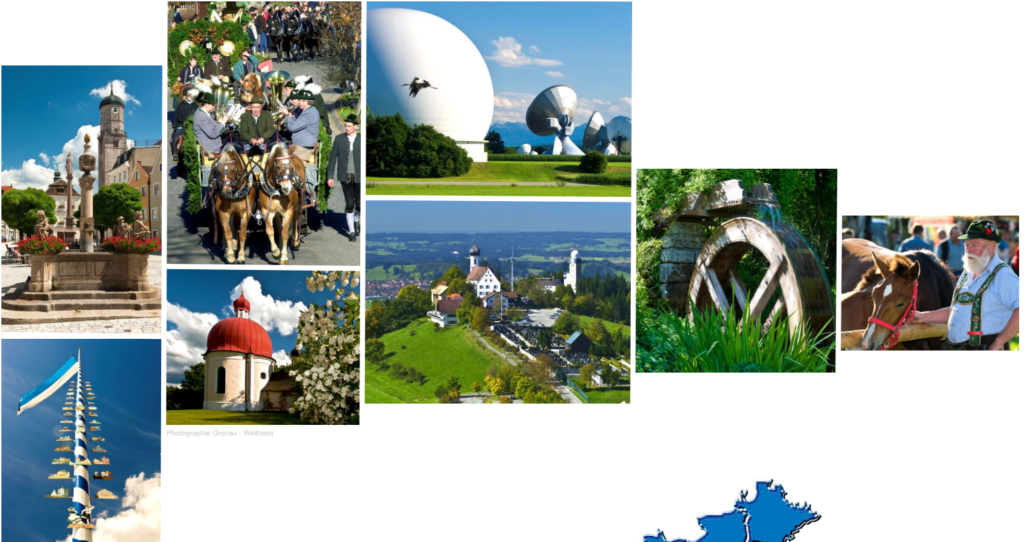
Photographie Gronau - Weilheim